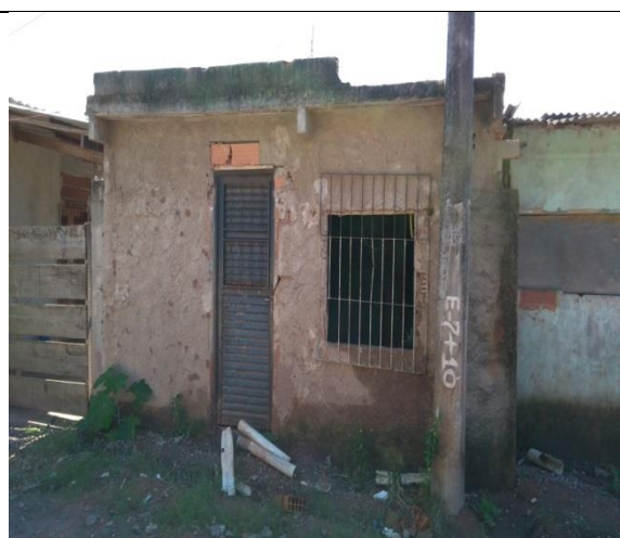
Fig. 10 Imagem residência localizada no Beco