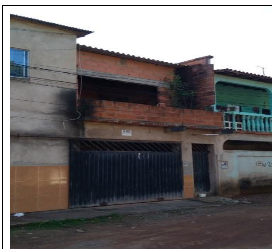
Fig. 9 Imagem residência localizada na rua Homero Massena