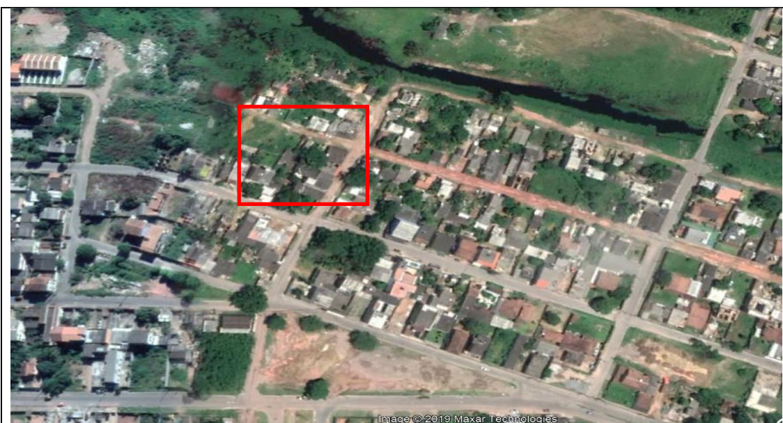
Fig.6 localização do Beco, onde foi identificada a maioria da população elegível.