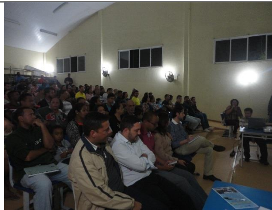
Imagens da Consulta Pública.