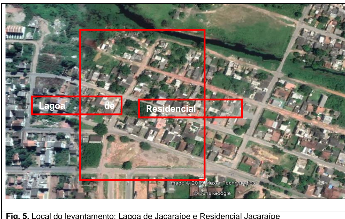
Fig. 5. Local do levantamento: Lagoa de Jacaraípe e Residencial Jacaraípe

A área identificada como passível de ter parcela da população elegível para as Políticas de Salvaguarda situa-se entre Lagoa de Jacaraípe e Residencial Jacaraípe, no Balneário de Jacaraípe, Serra ES. Registra-se que os dois segmentos acima identificados são divididos pela Rua a Homero Massena, sendo que do lado direito localiza-se o Residencial Jacaraípe e do lado esquerdo a Lagoa de Jacaraípe, conforme figura 05 abaixo.