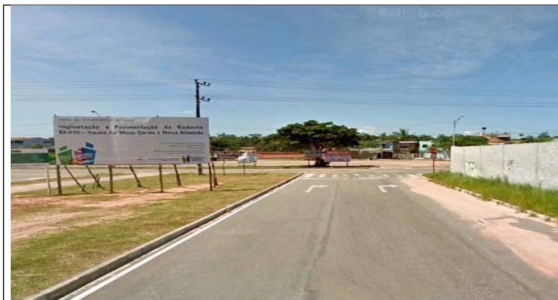
Fig. 3: Imagem início do Trecho 4 - Chegada da Rodovia Contorno de Jacaraípe no trevo de onde continuarão as obras: rua Homero Massena, rua Av. Hilário Sonegheti e Av. São Paulo.

A obra relativa à implantação da Rodovia ES-115, trecho: Av. Minas Gerais - Nova Almeida – Serra, se inicia 100 mt. antes da Av. Minas Gerais e 2,3 quilômetros depois o traçado se desenvolve em dois sentidos sendo um em direção a rodovia ES-010, no Loteamento Costa Bela, e o outro em direção a rodovia ES-264 no município de Nova Almeida.