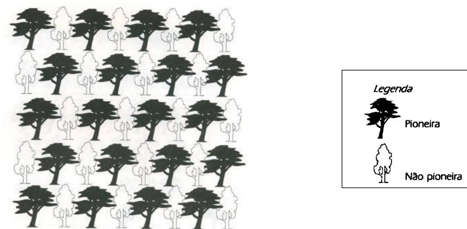
Figura 1 - Esquema de revegetação

No caso da recomposição com espécies arbóreas, recomenda-se o plantio de espécies pioneiras e não pioneiras de forma intercalada, essa forma tem como intuito o crescimento mais rápido das árvores pioneiras, para que se forme um microclima mais adequado para o desenvolvimento das espécies não pioneiras (Figura 1)